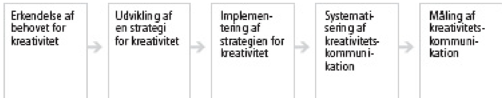
Figur 1: Kreativitetskommunikations fem trin, udviklet af Ditte Nielsen & Pernille Basballe