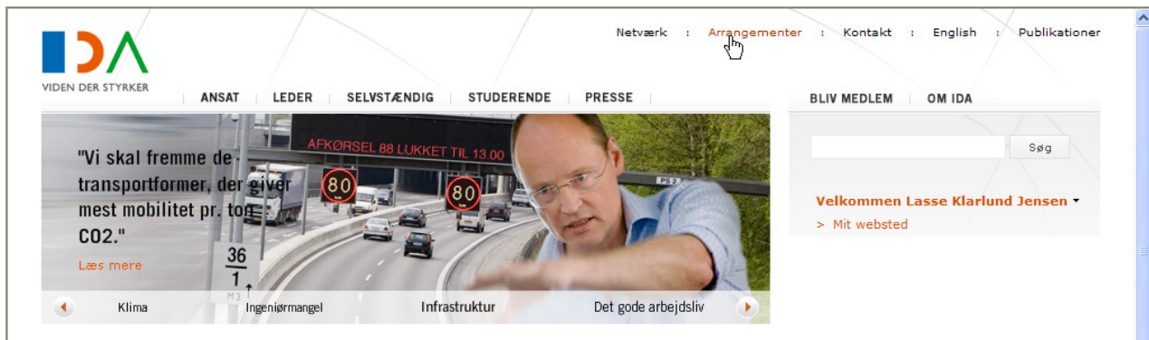
Figur 2. Arrangementer

Der fremkommer en liste med de fremtidige arrangementer i hele landet, se Figur 3