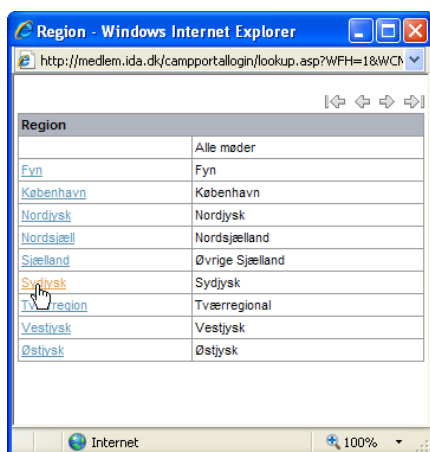
Figur 4. Pop op vindue regioner

Der klikkes eks. På sydjysk region. Pop op billedet forsvinder og nu står der Sydjysk i feltet ud for region. Inden søgningen startes, så vælges den datoperiode man vil søge på. Efter datoerne er valgt klikkes der på Start søgning