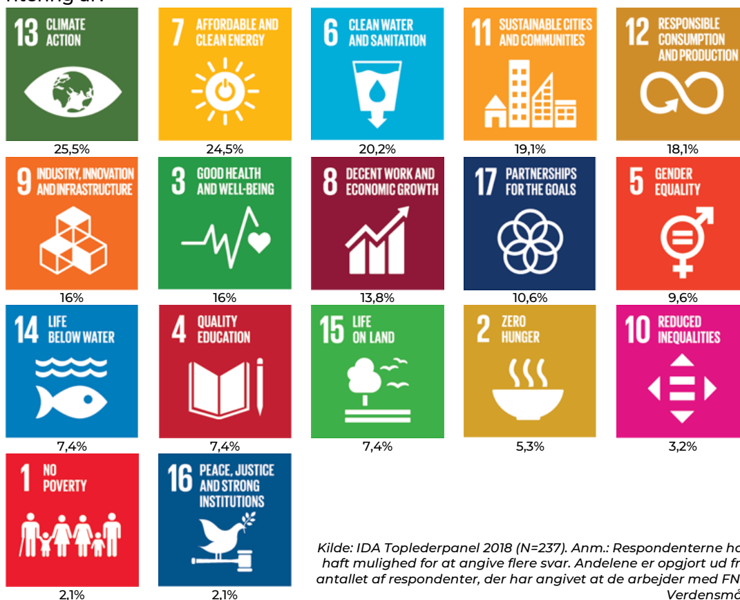
Figur 1. Hvilke Verdensmål har virksomheden foretaget en kortlægning og prioritering af?

Den store forskel mellem, hvilke af FN's Verdensmål hhv. de danske og internationale virksomheder arbejder med, rejser spørgsmålet om, hvordan virksomhederne udvælger de relevante Verdensmål at arbejde med. Én mulighed er, at virksomhederne arbejder med de af FN's Verdensmål, som i forvejen ligger inden for deres forretningsfelt og hvor de har den største indvirkning.